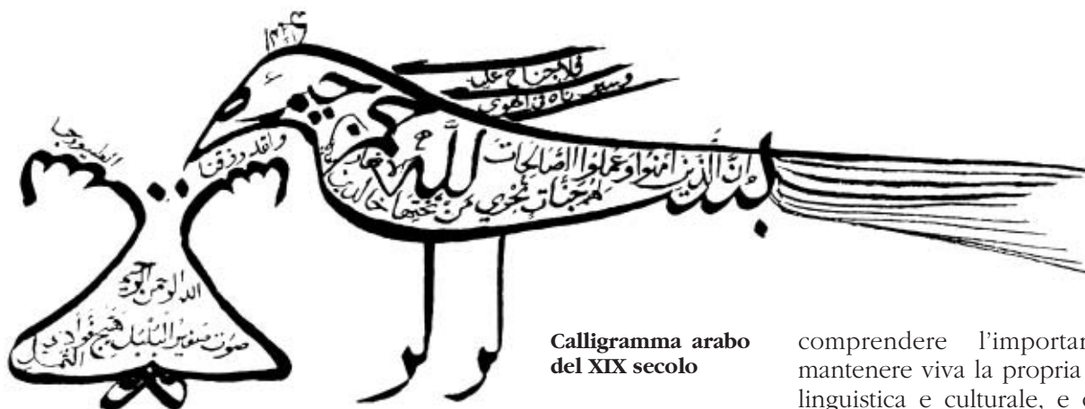
Calligramma arabo del XIX secolo

gno degli operatori per rendere dinamica l'offerta dei servizi della biblioteca, facendola dialogare con gli utenti in modo da creare uno spazio di incontro e confronto tra le diverse culture.