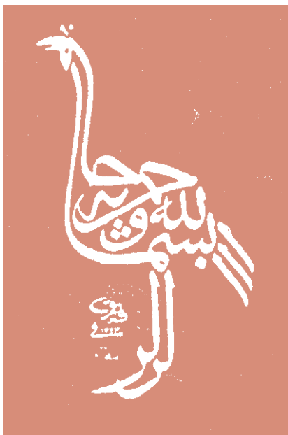
Illustrazione da Calligraphie arabe vivante di Hassan Massoudy, Flammarion

Tranne fortunate eccezioni come la Biblioteca "Lazzarini" di Prato, 11 che si avvale della stabile collaborazione di un mediatore di lingua araba per la scelta dei materiali da rendere disponibili per questa comunità, nella maggior parte dei casi sono i bibliotecari che si occupano di incrementare il patrimonio documentario in lingua, senza il supporto di adeguati strumenti bibliografici. Compito reso ancora più difficile dalla carenza di bibliografie o cataloghi specializzati che ostacola la costituzione di valide raccolte. Una volta individuati i materiali che si intendono acquistare, ci si scontra poi con i problemi dei costi e della