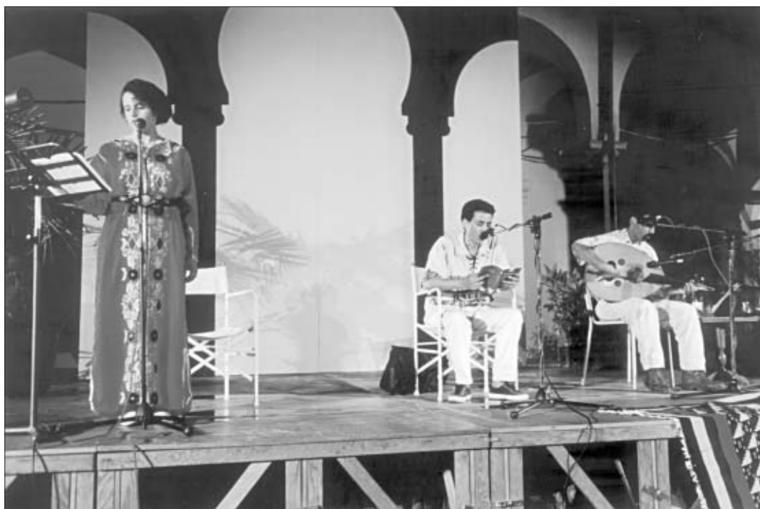
Letture di testi arabi accompagnati da musiche alla Biblioteca "Delfini" di Modena

L'organizzazione dello staff interno di una biblioteca multiculturale pone a tutt'oggi nel nostro paese difficoltà non indifferenti. È del tutto evidente la mancanza di una letteratura professionale che contribuisca a una formazione specifica dei bibliotecari (i pochi contributi esistenti sono quasi totalmente di matrice extra-bibliotecaria), 5 cui si accompagna una scarsissima attività di aggiornamento specifico. 6 Lo staff interno di una biblioteca multiculturale deve includere anche personale appartenente