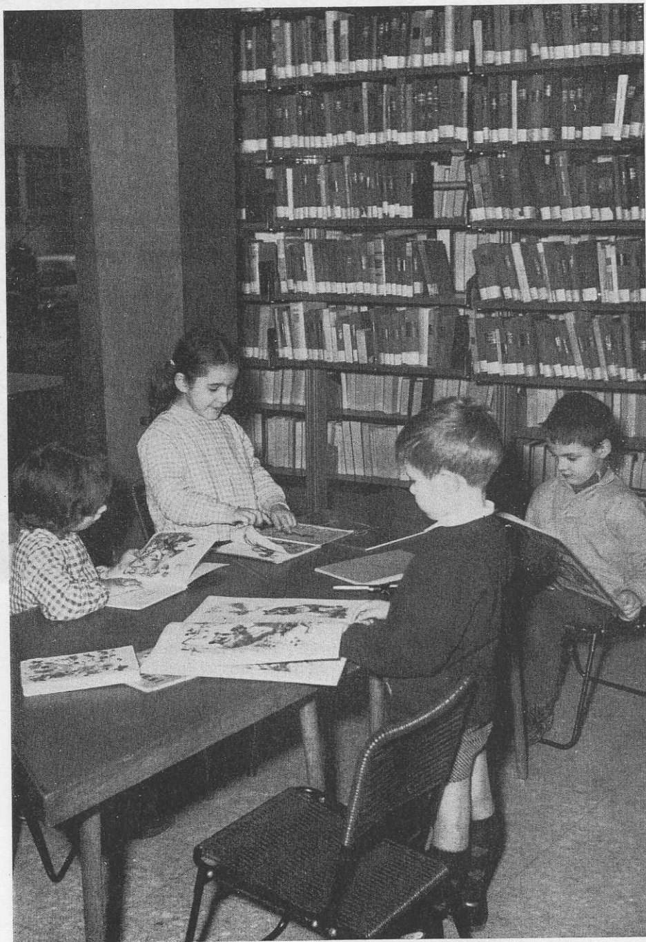
Ivrea. In alto, la sala della sezione di scienze sociali; in basso, una sala di lettura; a destra, la sezione letteratura infantile.