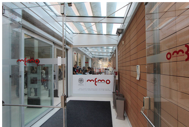
Ingresso della Mediateca Montanari, bancone informazioni

Sin dal primo momento, ponendo la domanda circa la Mediateca, ci siamo accorti che ottenevamo, piuttosto che una risposta chiara e distinta, la manifestazione di un'esigenza. Un bisogno sintetizzabile in questo modo: l'urgenza di riformulare la questione specifica sotto forma di interrogativo generale. In altre parole, l'esperienza sul campo ci ha consegnato quale suo frutto il tema che il dibattito biblioteconomico degli ultimi anni ha codificato come il problema dell'"identità" 44 della biblioteca pubblica contemporanea.