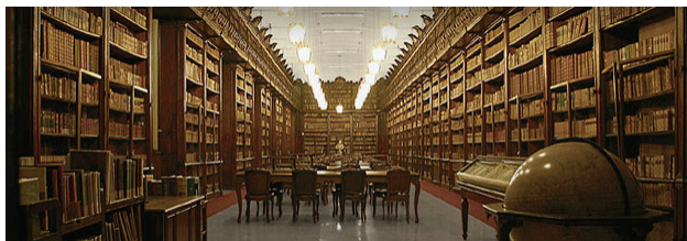
Fig. 1: Biblioteca Angelica (Roma)