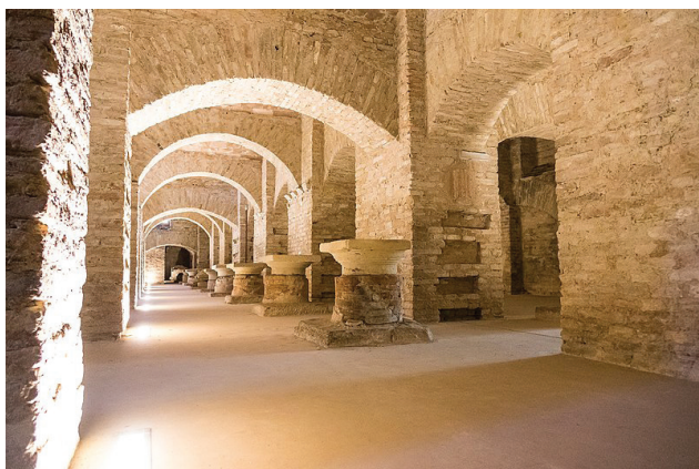
Sotterranei, scavi archeologici

concorrono a qualificarla all'interno di un determinato contesto sociale, culturale, ambientale ed economico. Un'impresa difficile oggi – nella complessità ambientale in cui siamo immersi – quando alla biblioteca vengono avanzate molteplici richieste non sempre coincidenti con funzioni e comportamenti coerenti, secondo gli addetti ai lavori, con la missione della biblioteca. Si tratta di qualcos'altro – azioni, atteggiamenti, valori che hanno a che fare con quella che potremmo chiamare una domanda sociale di biblioteca 48 – che si aggiunge al senso codificato dell'istituzione o meglio alla sua anima documentaria, quella di luogo deputato alla conser-