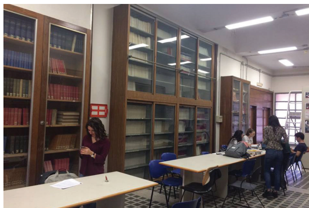
Fig. 4: Biblioteca di Fisiologia (Sapienza Università di Roma)

Luogo asettico che non fa sviluppare la fantasia. Tristi, senza personalità. Polverosa e anche un po' claustrofobica.