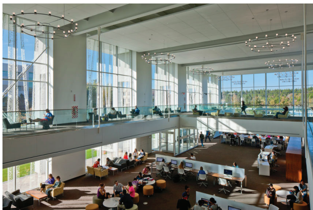
Fig. 2: Hans W. Klohn Commons at Saint John Campus (University of New Brunswick, Canada)