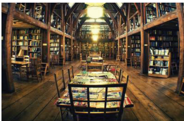
Fig. 3: The “Memorial Library” of Bedales Schools (Petersfield, Inghilterra)

Harry Potter docet e non solo per le fasce più giovani. Questa biblioteca non deriva esclusivamente da film o libri, ad esempio uno degli intervistati ha scelto come chiave di ricerca le espressioni: “biblioteca dei sogni” e “bibliotecario che sa tutto”.